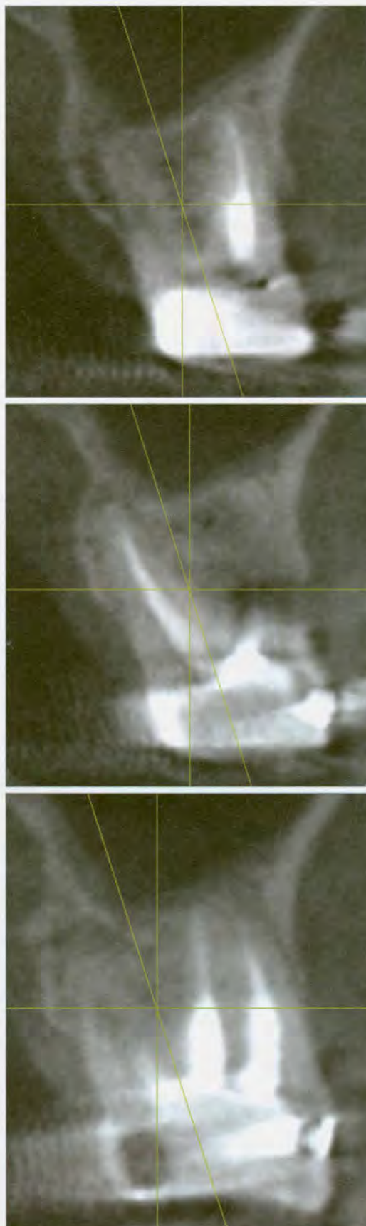
Abb. 2a–c: Kontrolle eines endodontisch versorgten Zahnes in Regio 27. Der Patient hat Beschwerden. a) Distobukkale Wurzel. b) Palatinale Wurzel. c) Zwei mesiobukkale Wurzeln.

3D-Diagnostik ist heute in der Implantologie unumstritten. Gab es 2002 noch die Empfehlung nur für die Defektklasse 4 (Hirsch et al.), so sahen bereits 2003 80 % der implantologisch tätigen Zahnärzte eine Indikation bei schwierigeren Fragestellungen, immerhin 65 % nutzten die Technik schon damals regelmäßig. Heute wissen wir, dass selbst bei vermeintlich einfachen Einzelimplantationen die 3D-Technik überraschende Ergebnisse liefern kann und überlegen ist. Im vergangenen Jahrzehnt wurde umfangreich über Fehlinterpretationen berichtet, die zu Komplikationen führten, sodass schon aus forensischen Gründen heute eine DVT-Aufnahme vor einer Implantation zu empfehlen ist. Die Möglichkeit, virtuell zu implantieren, ist bei Vorliegen der Daten dann nur ein logischer Schritt, der ebenfalls nicht mehr fehlen sollte. Programme, die dies heute in Mi-