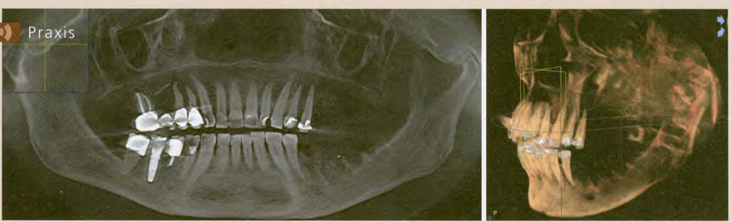
Abb. 1a u. b: Knochendestruktion durch ein Plattenepithelkarzinom im linken Oberkiefer. a) Aus DVT generierte Panoramaansicht. b) 3D-Ansicht desselben Patienten.